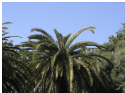
sintomi iniziali: asimmetria della cima

I proprietari di palme che intendano invece eliminare autonomamente piante infestate, dovranno avvisare per tempo il Servizio Fitosanitario Regionale prima dell’inizio delle operazioni per concordarne le modalità’. Sulle piante già infestate i trattamenti sono inefficaci. Poiche’ l’insetto è attratto dalle ferite dei tagli, sono da evitare gli interventi di potatura di foglie verdi.