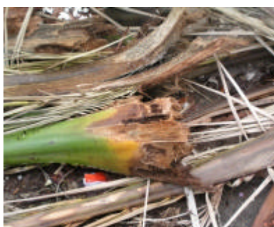
parte basale della foglia attaccata